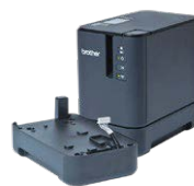
BASE DE BATERÍA PABB002