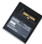
BATERÍA IONES LITIO PA-BT-4000LI